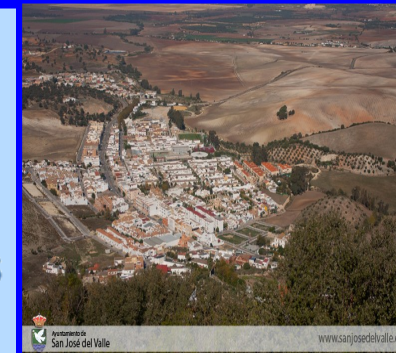
Ayuntamiento San José del Valle